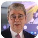
Herwig Kollar Präsident des Bundesverband Taxi und Mietwagen e.V.